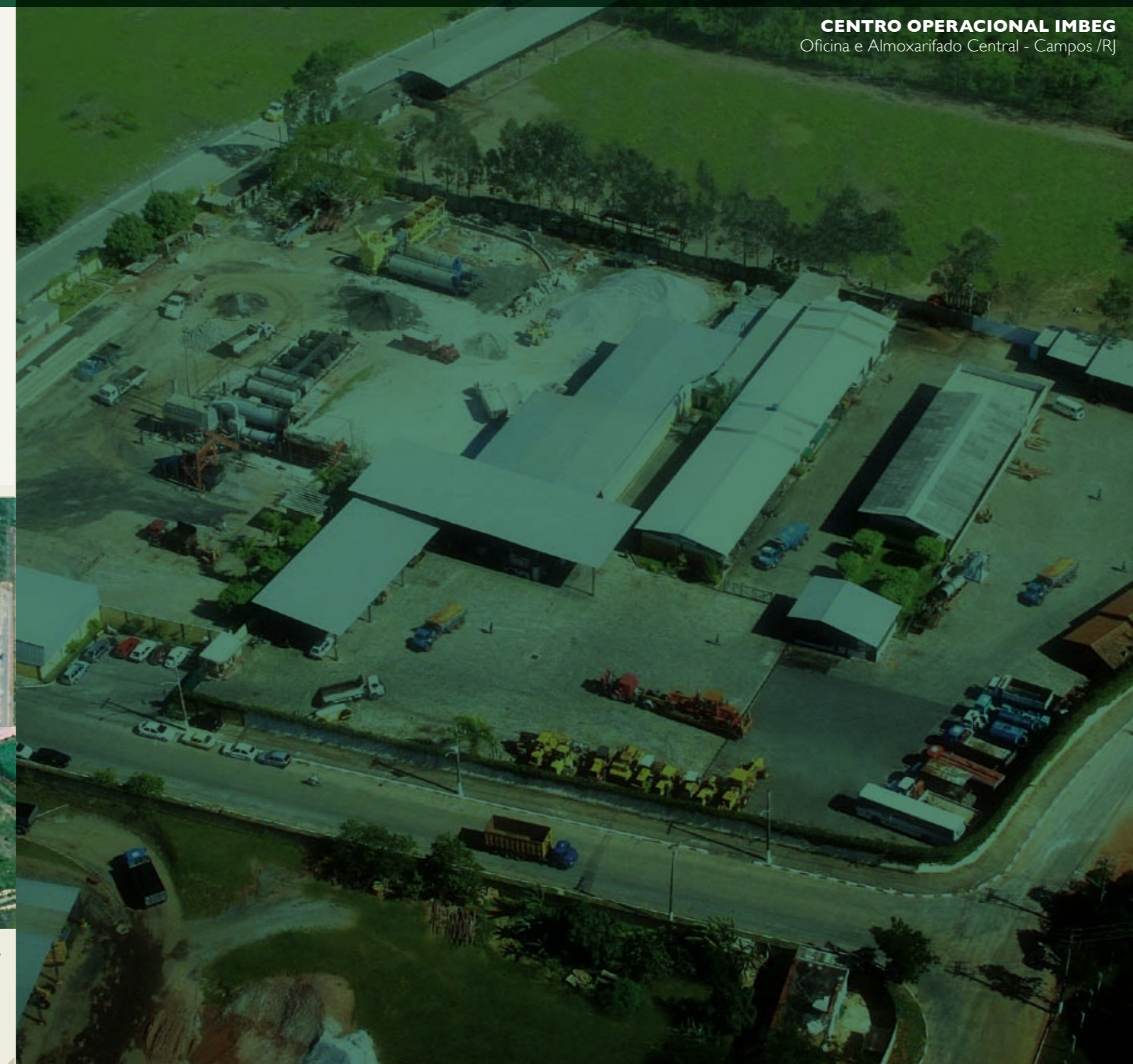
CENTRO OPERACIONAL IMBEG Oficina e Almoxarifado Central - Campos /RJ

um exemplo de recuperação de rodovias com a minimização do impacto ambiental. Nas obras contratadas junto ao DER-RJ, as rodovias RJ-158 entre Campos dos Goytacazes e São Fidelis; a rodovia RJ-224 e a rodovia RJ-216 – trecho Campos –RJ ao Farol de São Thomé – um total de 117 km foi restaurado com a utilização de equipamentos recicladores de última geração. Essa tecnologia permite que o antigo pavimento deteriorado seja reciclado e incorporado à nova pista de rolamento, trazendo qualidade construtiva e conforto aos usuários, aproveitando o que antes seria demolido e lançado no meio ambiente.