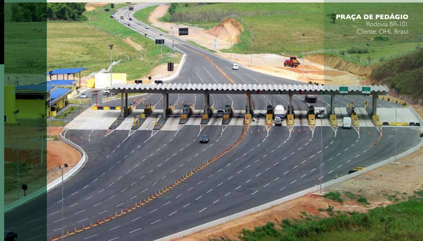
PRAÇA DE PEDÁGIO Rodovia BR-101 Cliente: OHL Brasil

A empresa destaca-se também na realização de obras de urbanização, saneamento e na construção de conjuntos habitacionais – Prefeitura de Campos dos Goytacazes e Prefeitura de Nova Iguaçu no Estado do Rio de Janeiro. Estações de Tratamento e Elevatórias de Esgoto – Concessionária PROLAGOS. Construção de Terminais Rodoviários Urbanos de Laranjeiras de Itaparica para o Governo do Estado do Espírito Santo. Para a OHL BRASIL, além da restauração de diversos segmentos da rodovia BR-101, no trecho sob concessão, executou a construção das Praças de Arrecadação de Pedágio localizadas no Norte Fluminense.