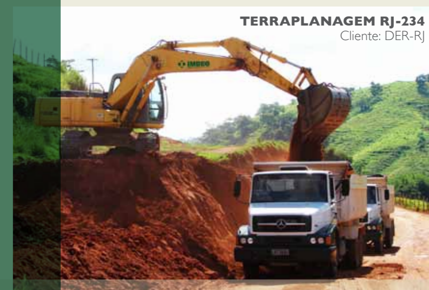
TERRAPLANAGEM RJ-234 Cliente: DER-RJ