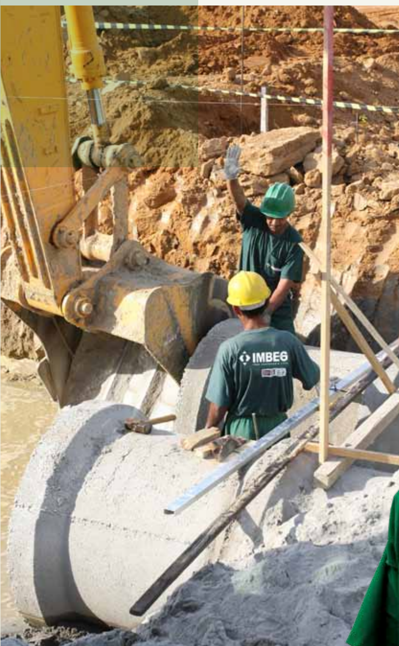
SANEAMENTO, URBANIZAÇÃO E HABITAÇÃO. Cliente: Prefeitura Municipal de Nova Iguaçu /RJ

é por meio desta equipe que a empresa desenvolve sua competência empresarial de forma eficaz e responsável, aplicando seu potencial de trabalho e profissionalismo na concretização de compromissos e objetivos.