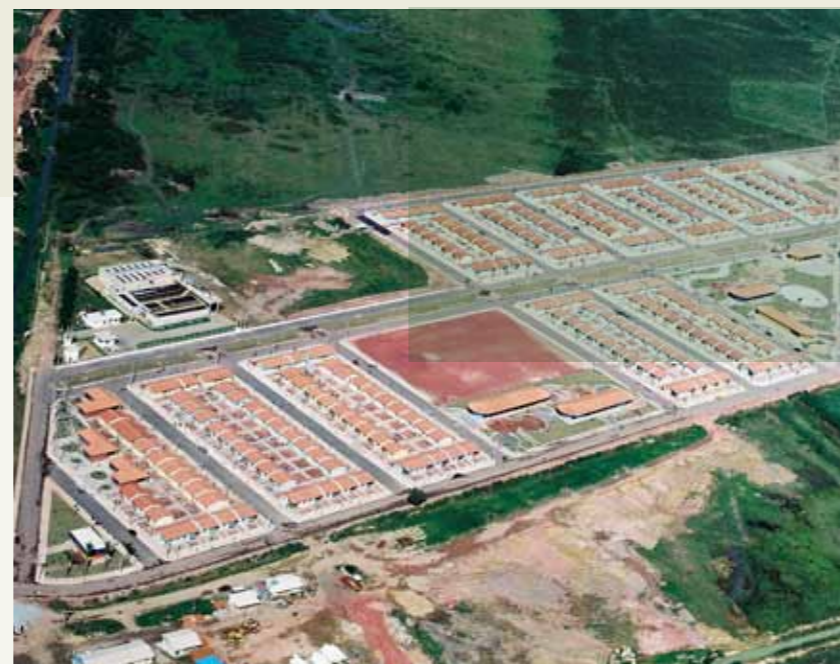
CONJUNTO HABITACIONAL NOVA CHATUBA Cliente: Prefeitura Municipal de Campos / RJ

A IMBEG destaca-se também na construção de obras com a preservação do meio ambiente. Isso só foi possível graças a uma política constante de investimentos na atualização e aquisição de equipamentos dotados de modernas tecnologias que colaboram para minimizar o impacto ambiental. Alguns exemplos: milhares de toneladas de concreto betuminoso, usinado à quente foram produzidos em nossas usinas de asfalto e aplicados em rodovias e vias urbanas com a adição de borracha reciclada. Com isso além do aspecto positivo de melhorar as características do pavimento, milhares de pneus deixaram de ser lançados em nossos rios e canais. A utilização da técnica de reciclagem “in situ” também é mais