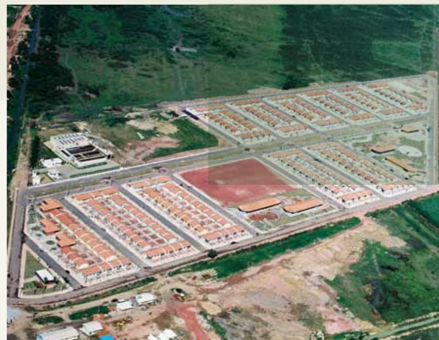
CONJUNTO HABITACIONAL NOVA CHATUBA Cliente: Prefeitura Municipal de Campos / RJ

A IMBEG destaca-se também na construção de obras com a preservação do meio ambiente. Isso só foi possível graças a uma política constante de investimentos na atualização e aquisição de equipamentos dotados de modernas tecnologias que colaboram para minimizar o impacto ambiental. Alguns exemplos: milhares de toneladas de concreto betuminoso, usinado à quente foram produzidos em nossas usinas de asfalto e aplicados em rodovias e vias urbanas com a adição de borracha reciclada. Com isso além do aspecto positivo de melhorar as características do pavimento, milhares de pneus deixaram de ser lançados em nossos rios e canais. A utilização da técnica de reciclagem “in situ” também é mais