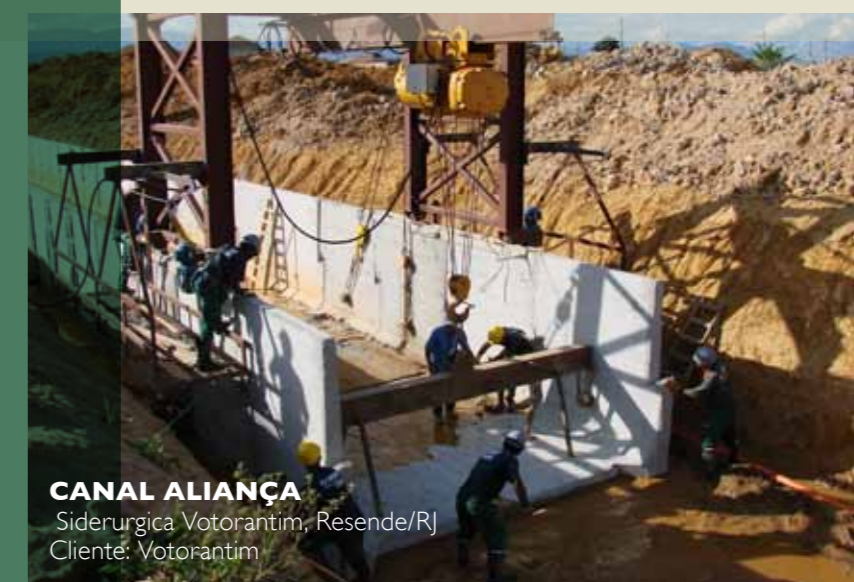
CANAL ALIANÇA Siderúrgica Votorantim, Resende/RJ Cliente: Votorantim

Laranjeiras de Itaparica para o Governo do Estado do Espírito Santo. Para a OHL BRASIL, além da restauração de diversos segmentos da rodovia BR-101, no trecho sob concessão, executou a construção das Praças de Arrecadação de Pedágio localizadas no Norte Fluminense.