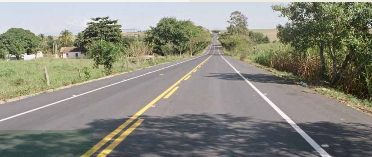
RODOVIA RJ-158 Campos – São Fidelis Cliente: DER-RJ

Os colaboradores da IMBEG são a razão para o sucesso da empresa. Na IMBEG o ser humano vem em primeiro lugar, ele é o seu maior ativo. Proporcionar e promover o bem-estar entre seus colaboradores também é uma missão, afinal,