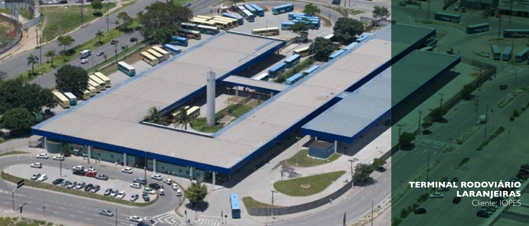
TERMINAL RODOVIÁRIO LARANJEIRAS Cliente: IOPES