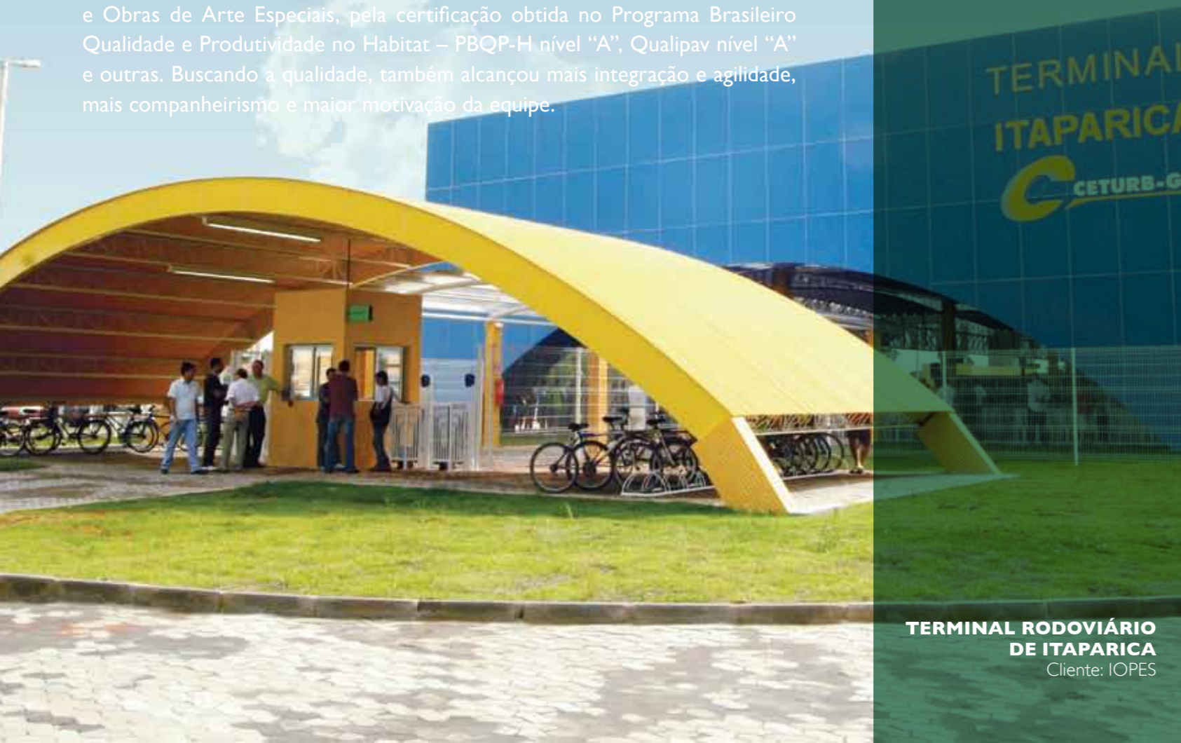
TERMINAL RODOVIÁRIO DE ITAPARICA Cliente: IOPES

Para a IMBEG, qualidade não é apenas um objetivo a ser alcançado, mas um COMPROMISSO que se renova com o investimento contínuo na formação, capacitação e aperfeiçoamento de nossos profissionais na busca de conhecimento e do aprimoramento para fazer o melhor. Por isso cada integrante da equipe da empresa é incentivado a incorporar a missão de melhorar continuamente os processos produtivos. A satisfação dos seus clientes é a sua diretriz e sua meta. A busca dessa satisfação se reafirma nas certificações obtidas pela empresa, como o sistema de gerenciamento de qualidade conforme NORMA ISO -9001, para execução de obras de Edificações, Pavimentação, Drenagem e Obras de Arte Especiais, pela certificação obtida no Programa Brasileiro Qualidade e Produtividade no Habitat – PBQP-H nível "A", Qualipav nível "A" e outras. Buscando a qualidade, também alcançou mais integração e agilidade, mais companheirismo e maior motivação da equipe.