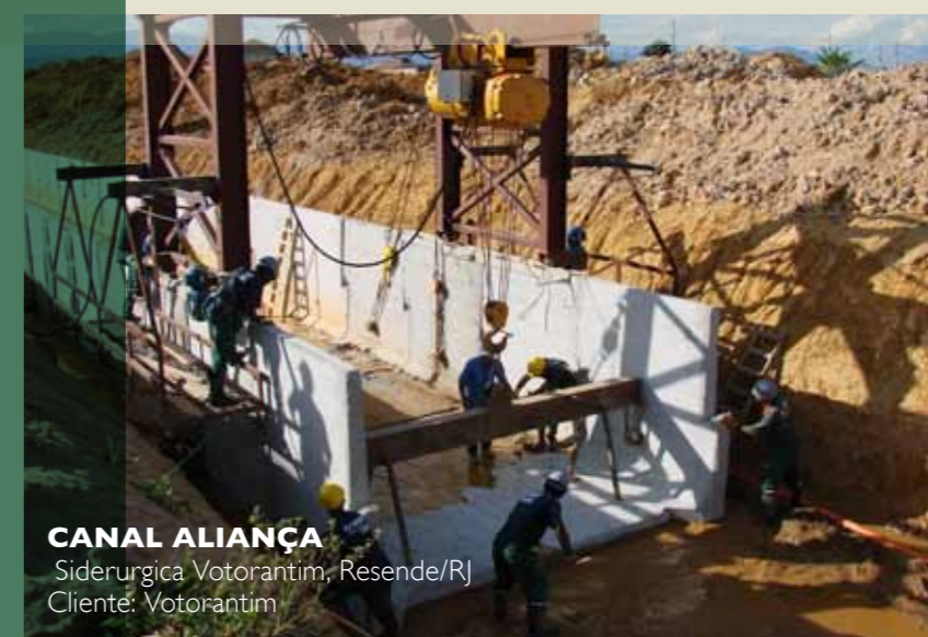
CANAL ALIANÇA Siderúrgica Votorantim, Resende/RJ Cliente: Votorantim